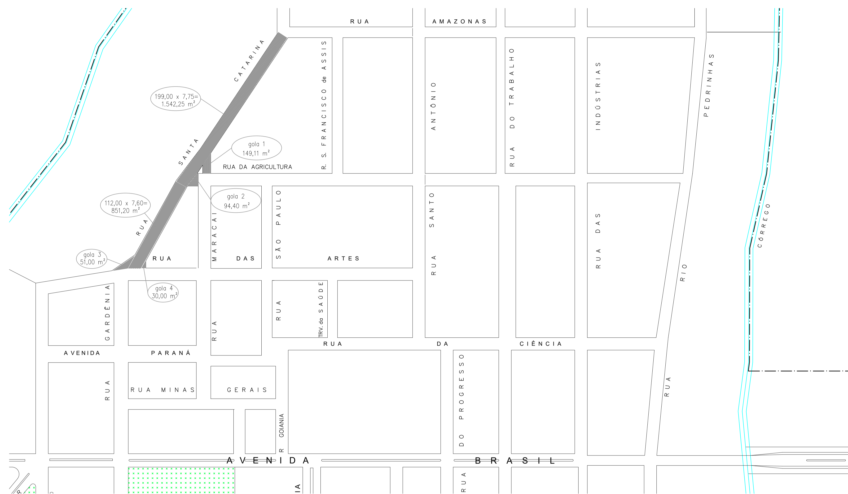
Croqui das Ruas