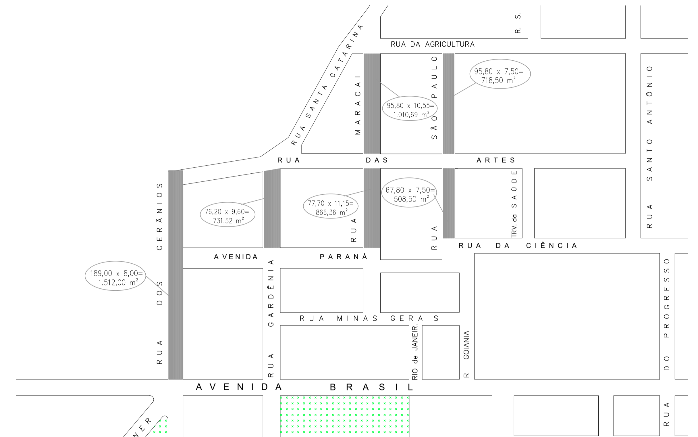
Croqui das Ruas