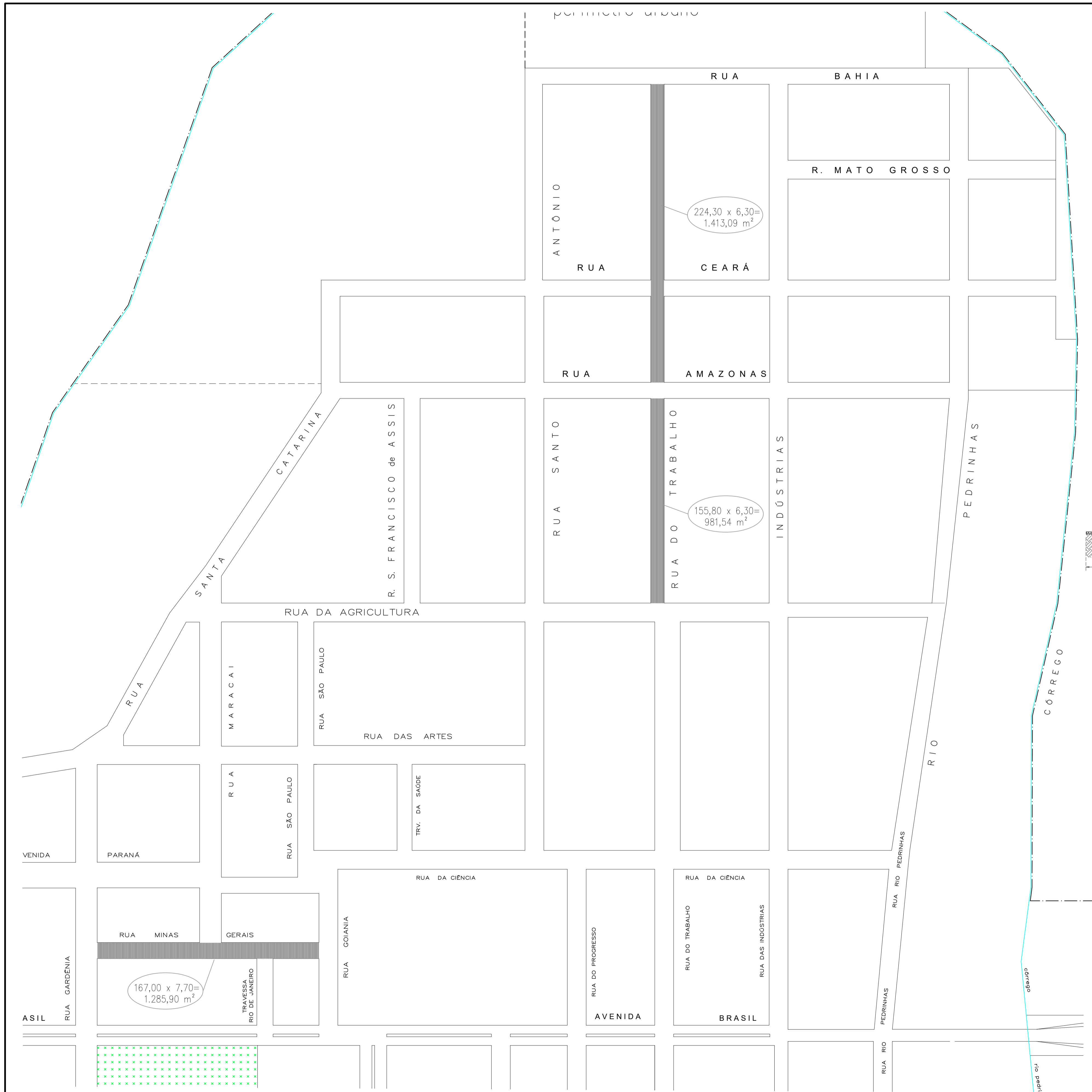
Croqui das Ruas