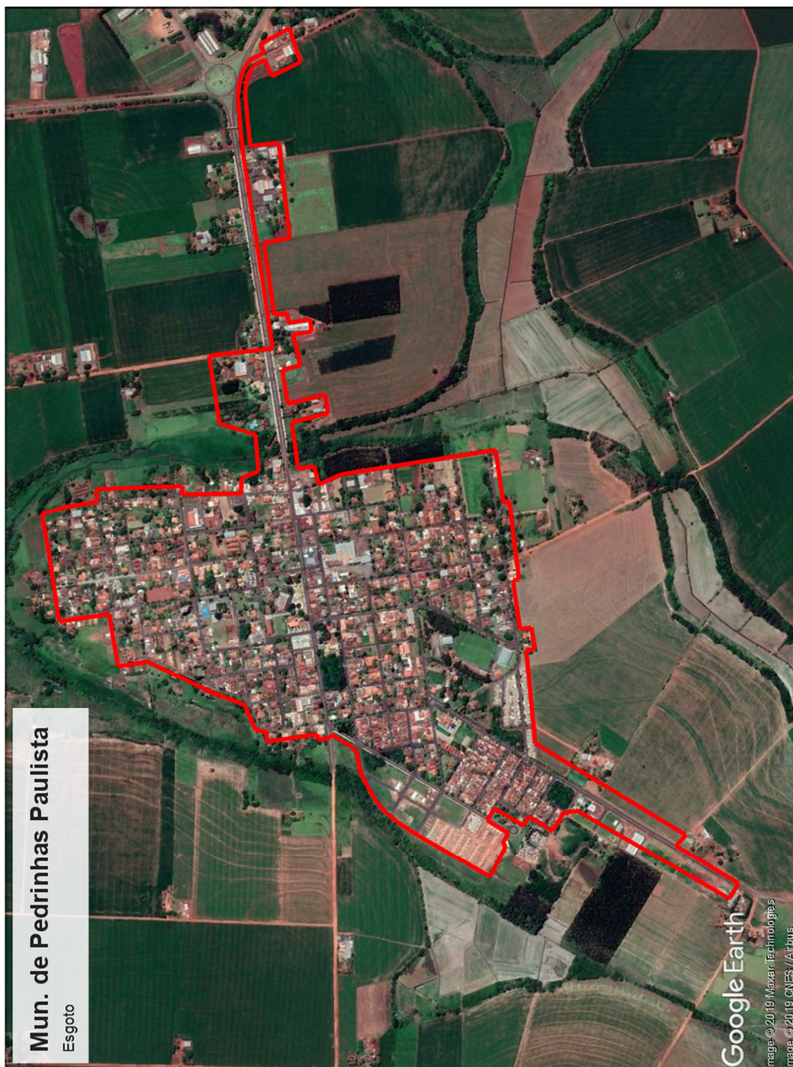
Figura 2: Área atendível de esgotamento sanitário - Sede